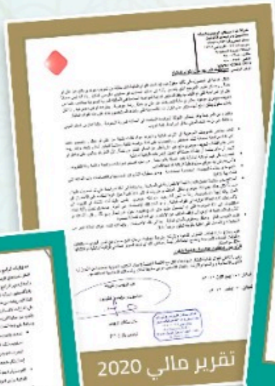
تقرير مالي 2020