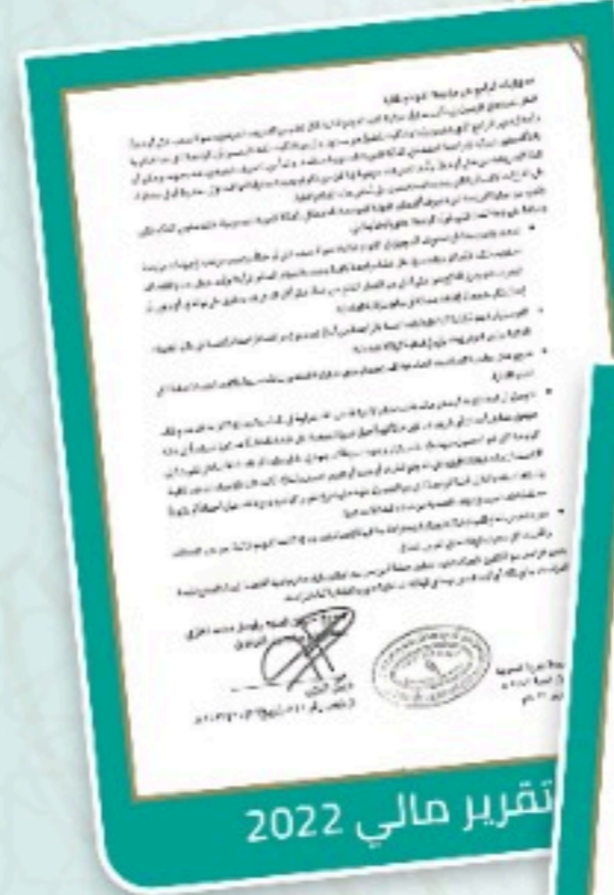
تقرير مالي 2022