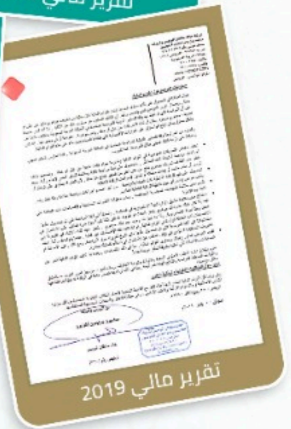
تقرير مالي 2019