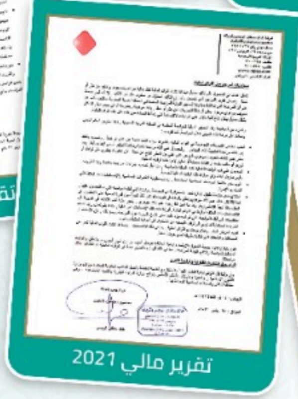
تقرير مالي 2021