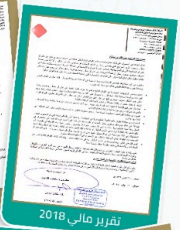
تقرير مالي 2018