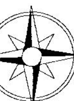
1 = 0.00